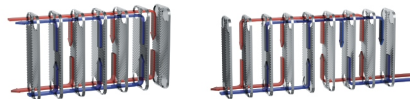
Однопоточный каналы соединены параллельно